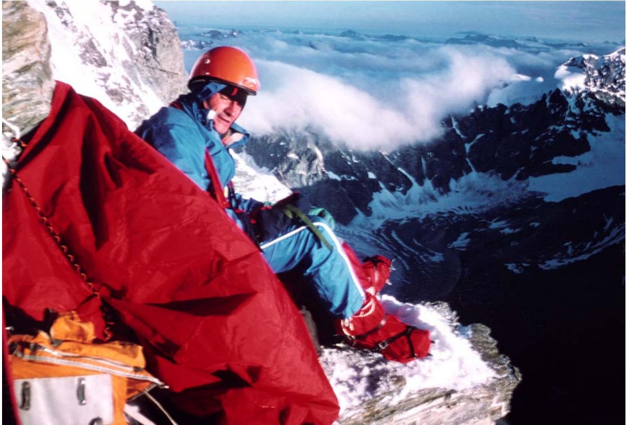
Am Morgen nach der Biwaknacht